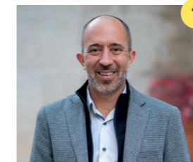
Marc Aloy Guàrdia Arquitecte. Alcalde de Manresa